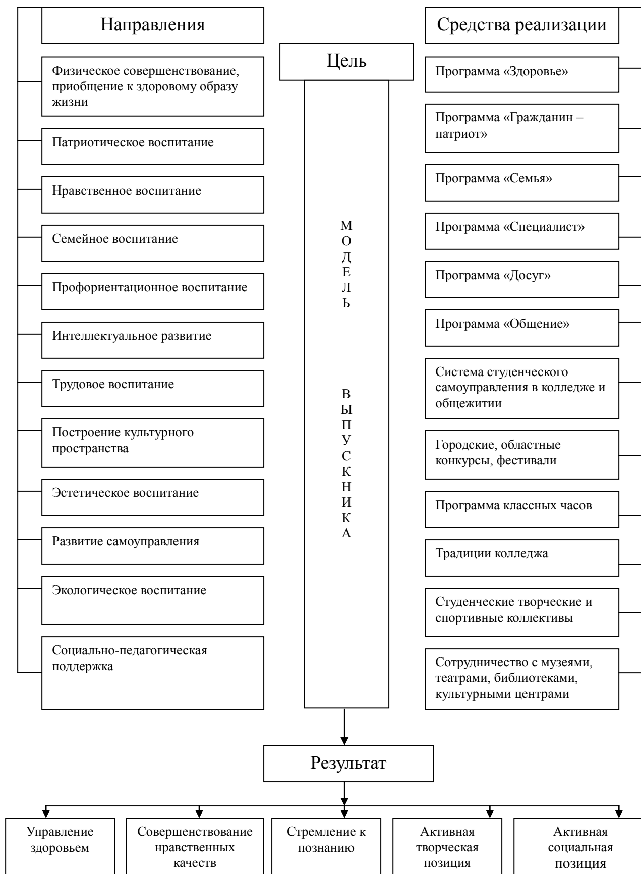
Схема 1. Система воспитательной работы Архангельского индустриально-педагогического колледжа